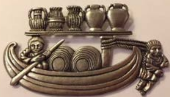
Confrérie de la Truffe et du Vin du Luberon

Confrérie de la Truffe et du Vin du Luberon – Place de l'Horloge – 84560 MENERBES email : alain@lagarelle.fr